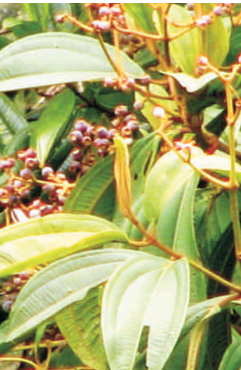
Figura 1. Porcentaje de visitas de aves de la familia Thraupidae