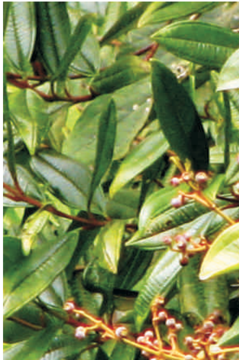
Tabla 1. Porcentaje de visitas de aves que se alimentan de frutos de Miconia floribunda (Bonpl) DC.