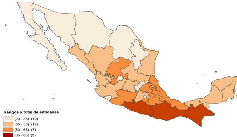
Figura 1. Porcentaje de población en pobreza, según entidad federativa, Estados Unidos Mexicanos, 2014.

cual hace que algunos municipios como los de Puebla presenten condiciones similares a regiones, de otras latitudes como oriente medio o algunas regiones de África. Presentamos un mapa de los estados con mayor concentración de pobreza.