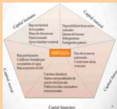
Figura 1. Contexto de vulnerabilidad en las fincas tradicionales de la vereda Leonera, municipio de Tuta (Boyacá) Gráfico adaptado de DFID (1999).

índice de bienestar o carencia que muestra cada capital según el DFID, sino de manera particular, con el objeto de mostrar el contexto de vulnerabilidad analizado dentro de la investigación.