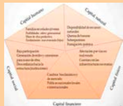
Figura 2. Contexto de vulnerabilidad en las fincas diversificadas de la vereda Leonera, municipio de Tuta (Boyacá) Gráfico adaptado de DFID (1999).

bleció que el capital humano, como motor de los medios de vida, se encuentra en riesgo, por el ciclo de vida de las familias, lo que repercute en los otros capitales directa o indirectamente.